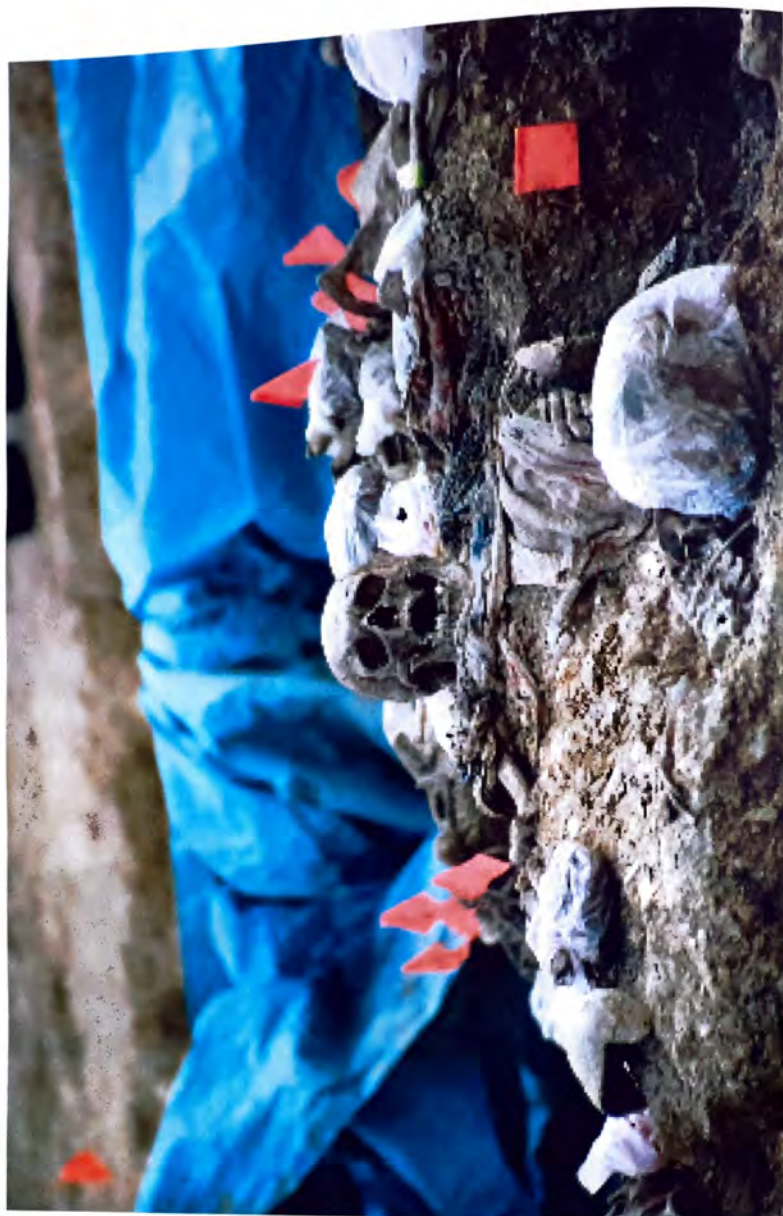
BUDAK — Stravični dokazj o genocidu —