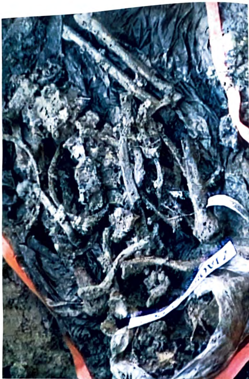
ZELENI JADAR – Dokazji o genocidu –