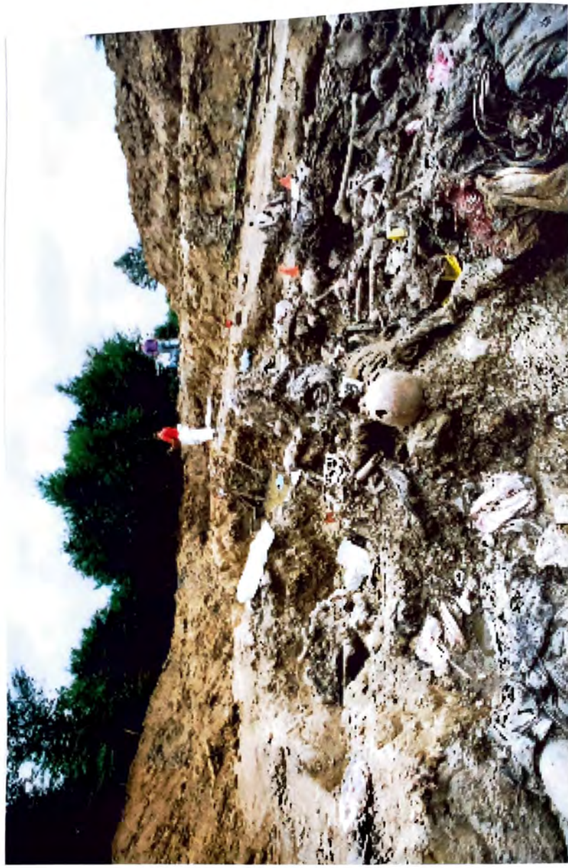
BUDAK – Dokazji žlodična genocida –