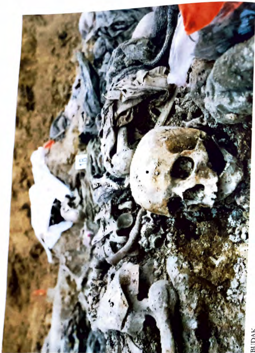
BUDAK - Dokazji zločina genocida -