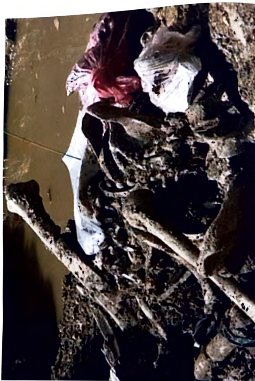
BUDAK — Zrtve genocida u vodi —