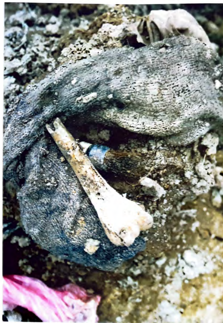
BUDAK – Pomiješani ostaci kostiju i odjeće –