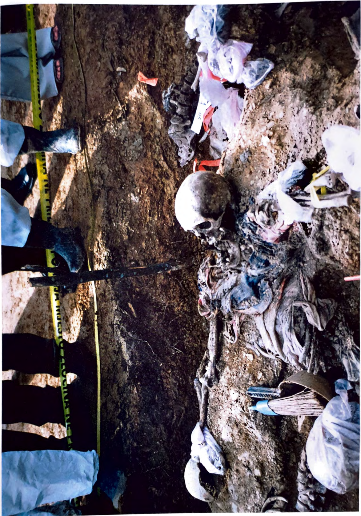
BUDAK – Detaljno obradena masovna grobnica –