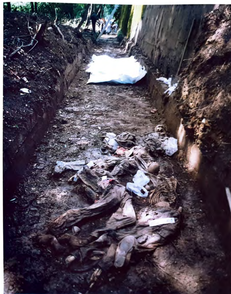
SANDIĆI – Ekshumacija masovne grobnice –