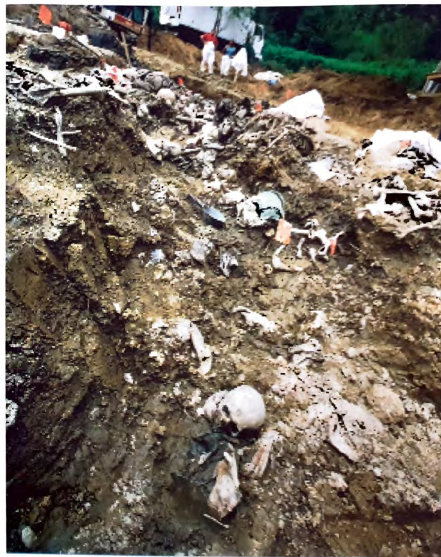
BUDAK – Dokazi zločina genocida –