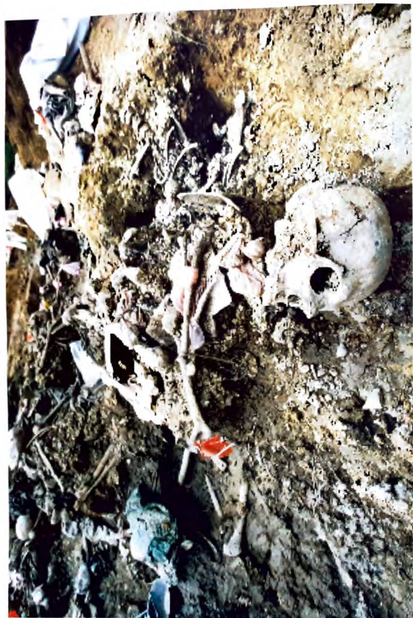
BUDAK - Dokazji zločina genocida -