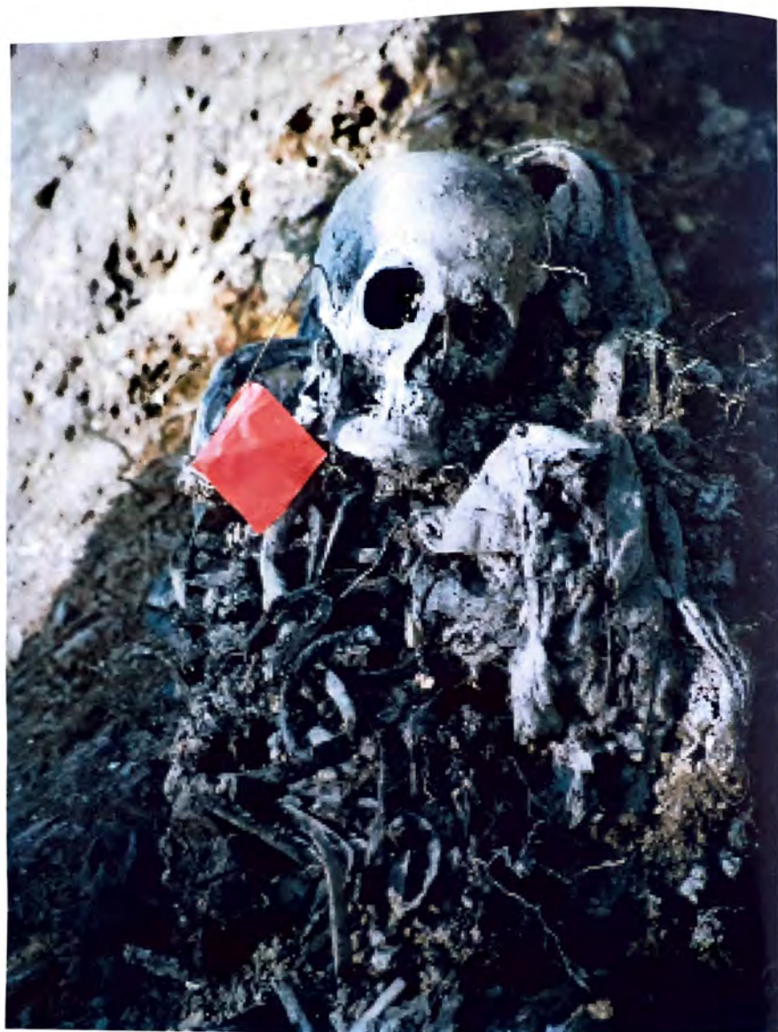
BUDAK – Dokazi o genocidu –