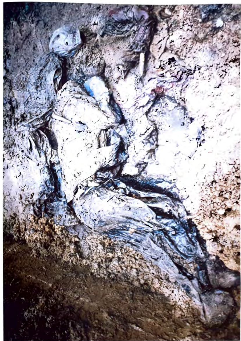
SANDŽICI – Otkriveni skeletni ostaci u jednom nepristupačnom i vlažnom kanalu pored ceste u Sandžicima –