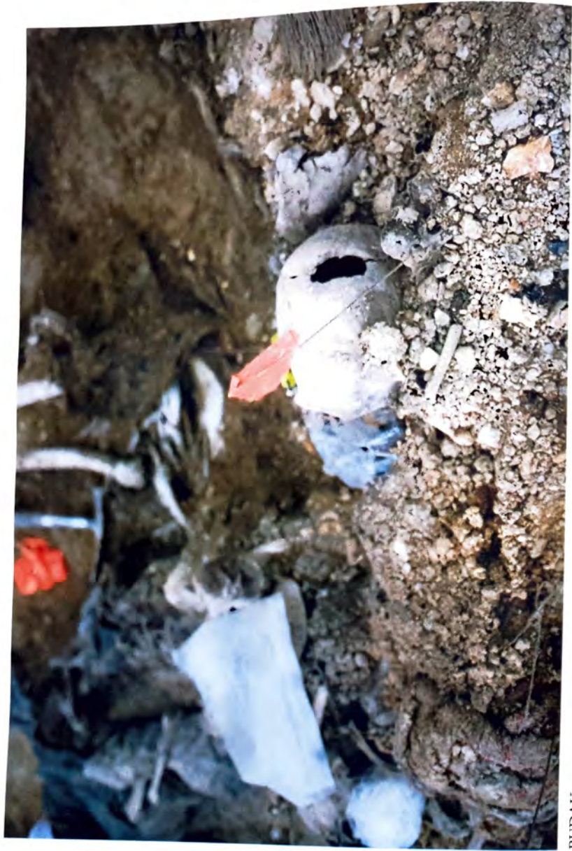
BUDAK — Označke dijelova tijela —