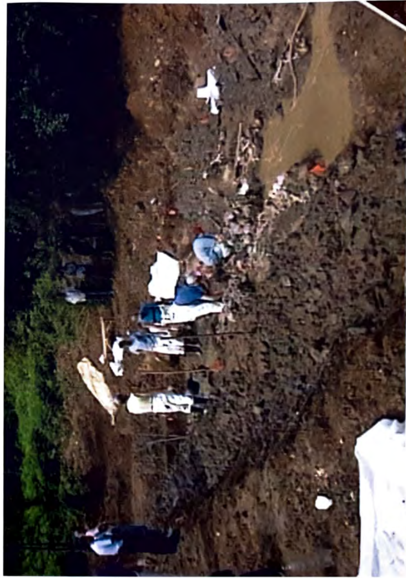
BUDAK – Teški najeti ekshumacija –