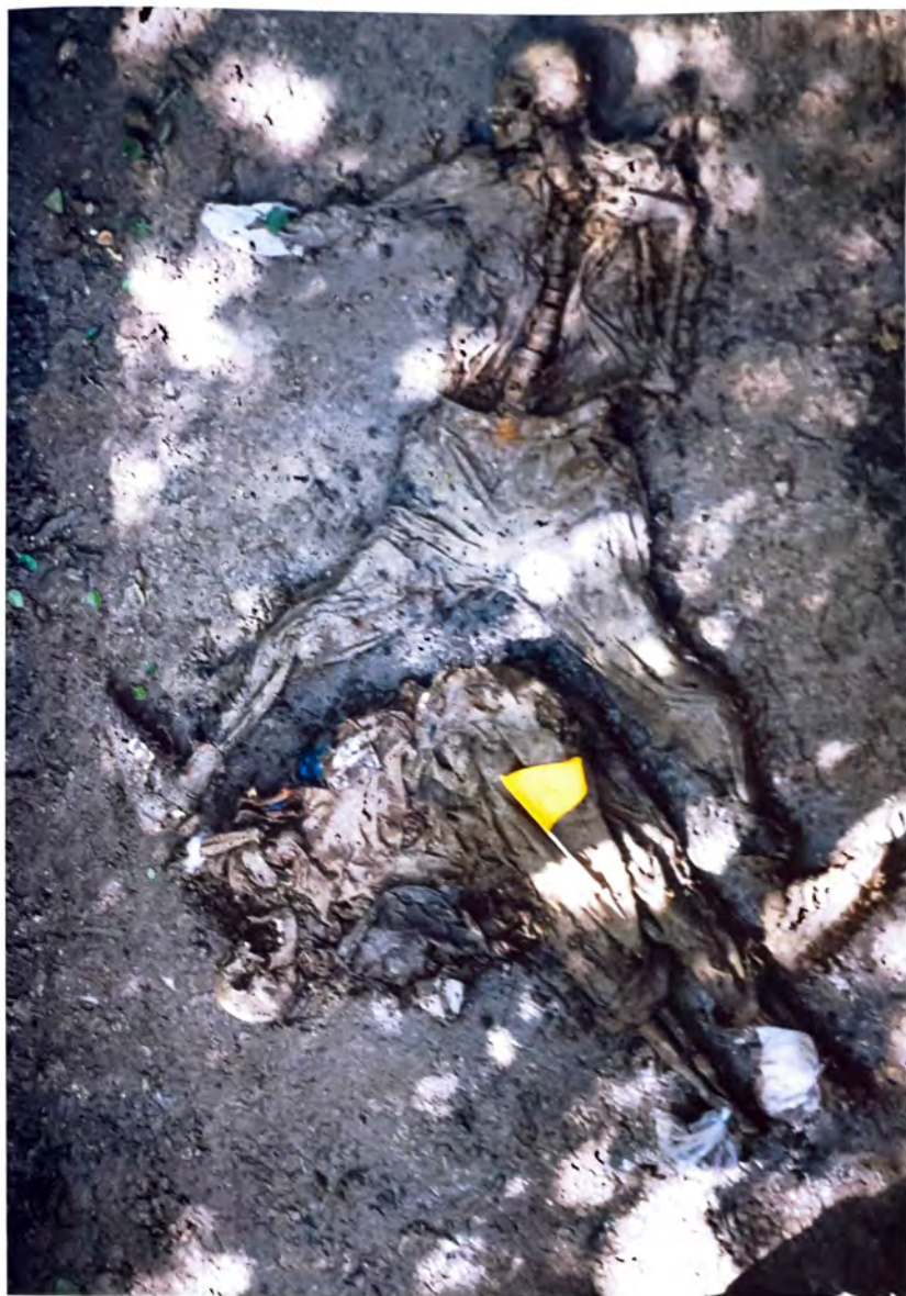
SANDIĆI – Žrtve genocida –