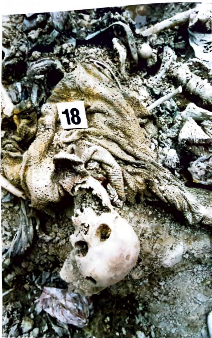
BUDAK – Žrtve genocida –