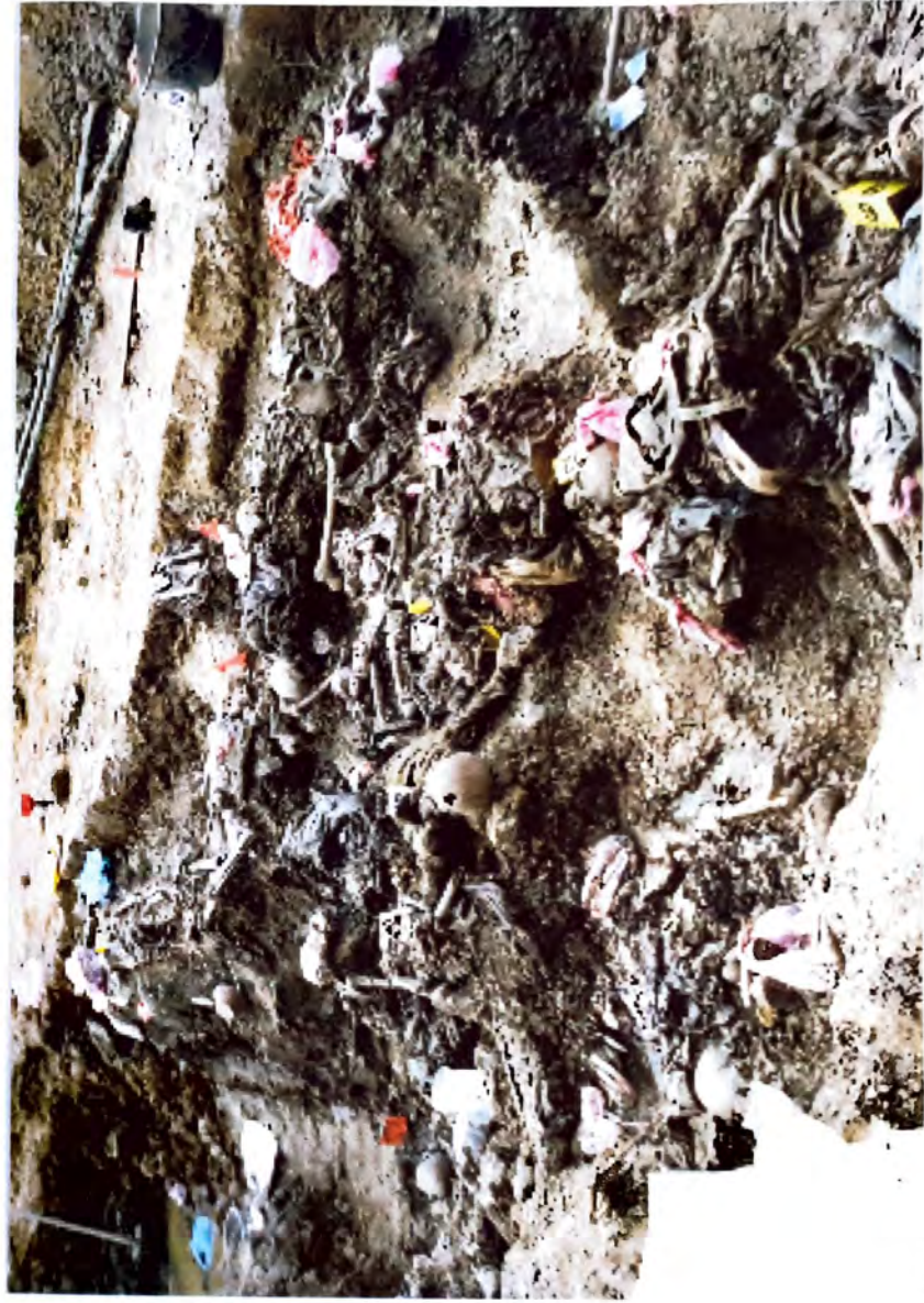
BUDAK — Dokazí zločina genocida —