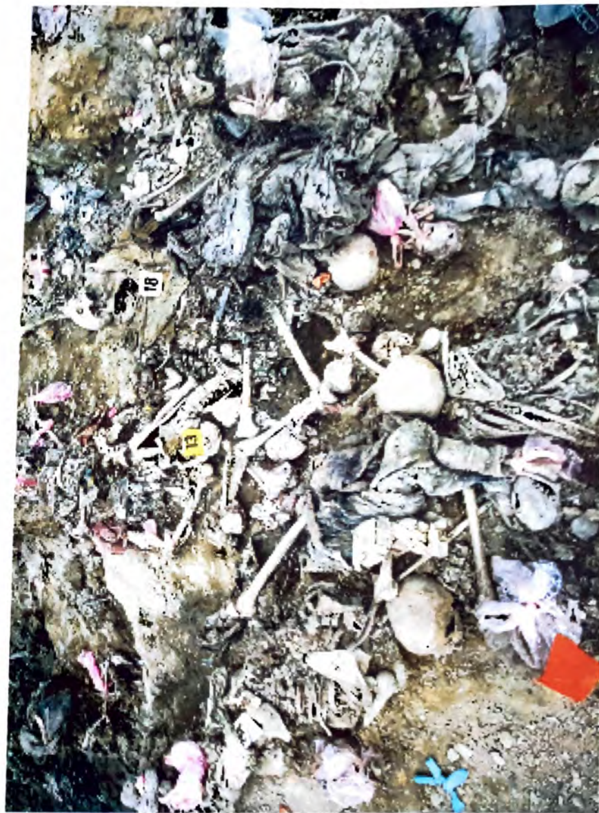
BUDAK - Dokazji zločina genocida -