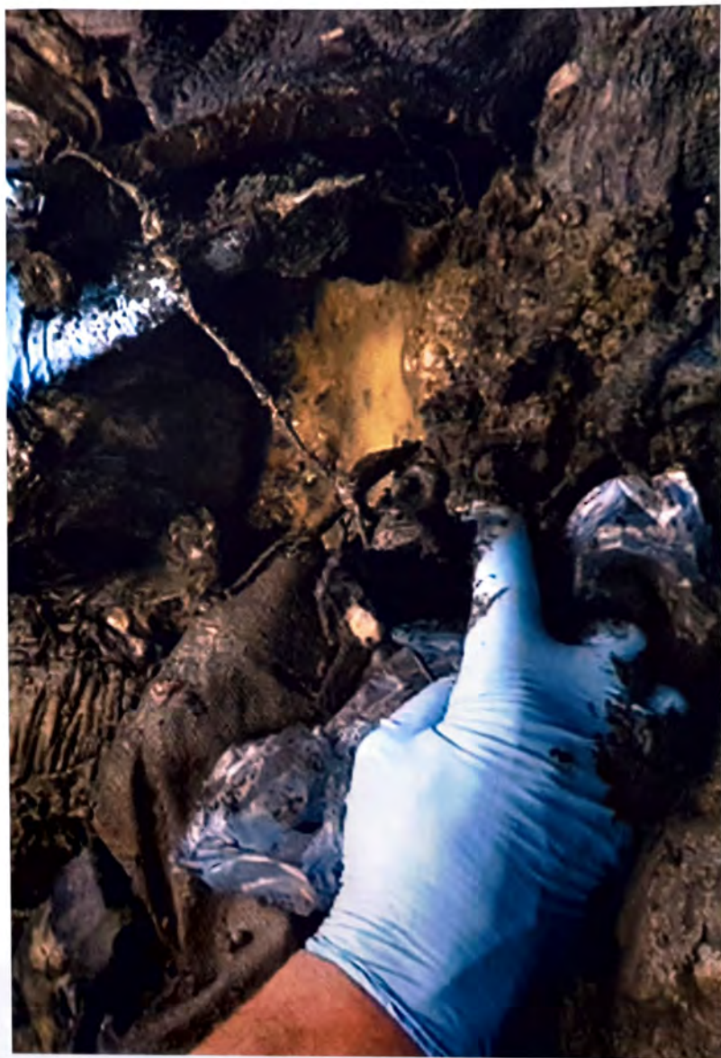
BIŠINA — Dokazi zarobljavanja i zlostavljanja prije masovnog smaknuća —