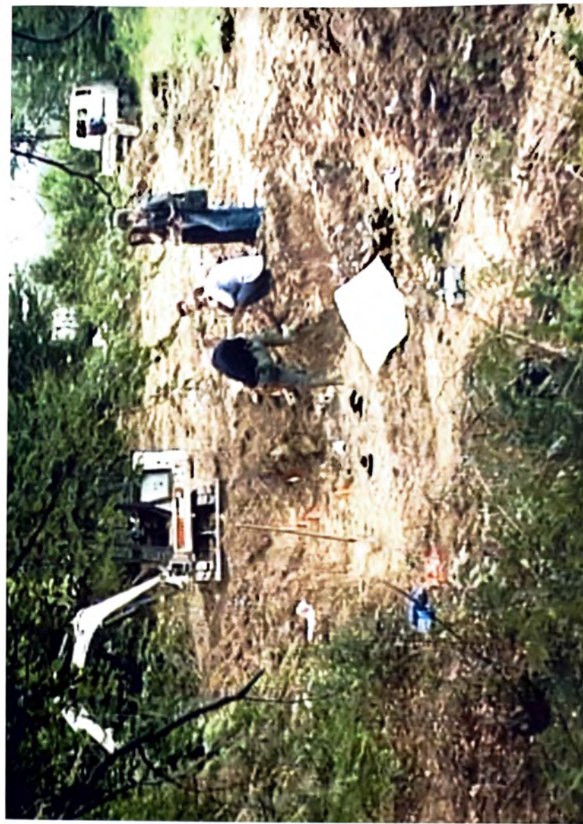
ZELENI JADAR — Timski rad na ekshumacijama —