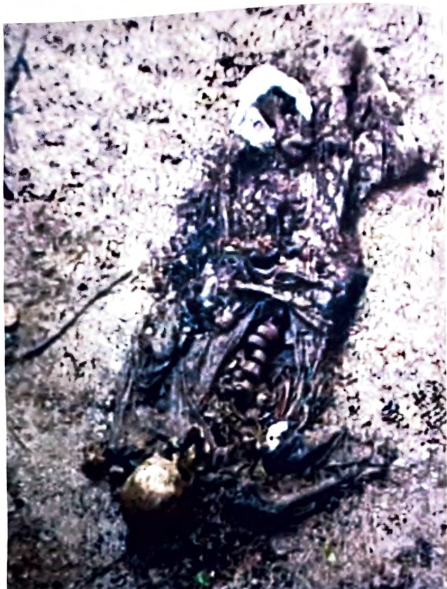
SANDIĆI – Jezini prizori zločina –