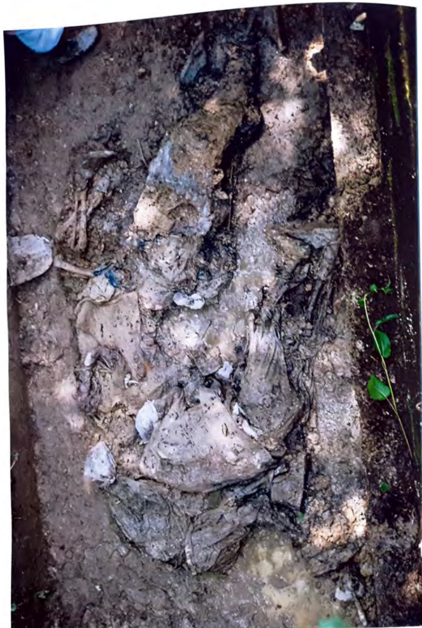
SANDŽICI – Masovna grobnica u Sandžicima –