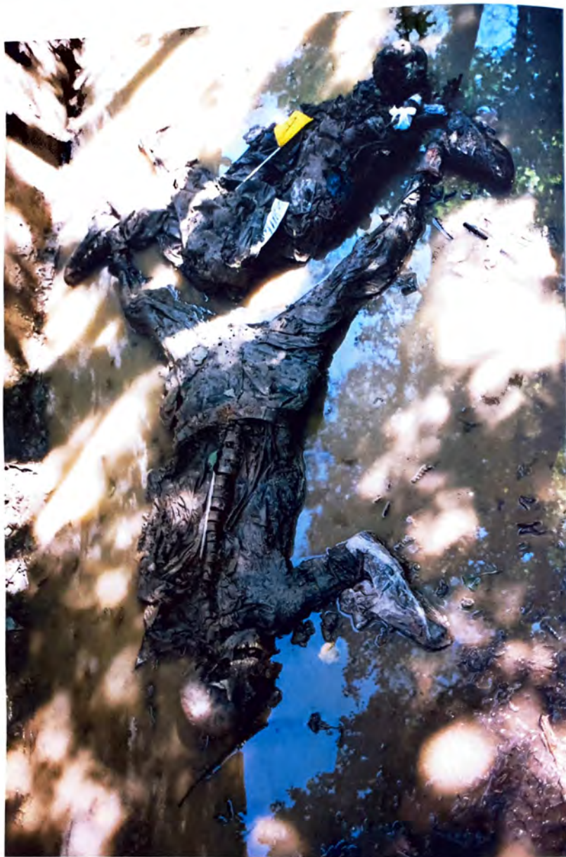
SANDIĆI – Skeletni ostaci –