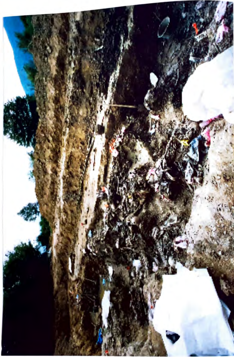
BUDAK — Dokazí zločina genocida —