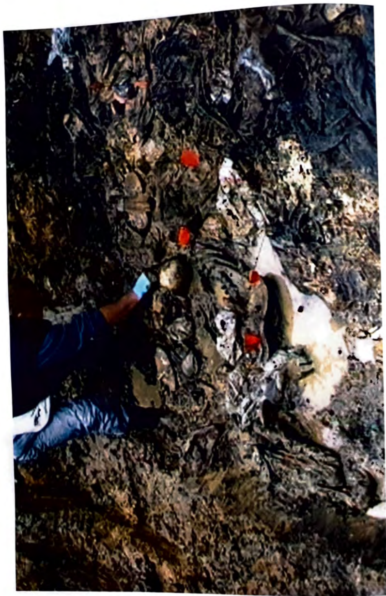
BIŠINA — Užasni prizori koji svedoče o zločinima genocida nad Bošnjacima —