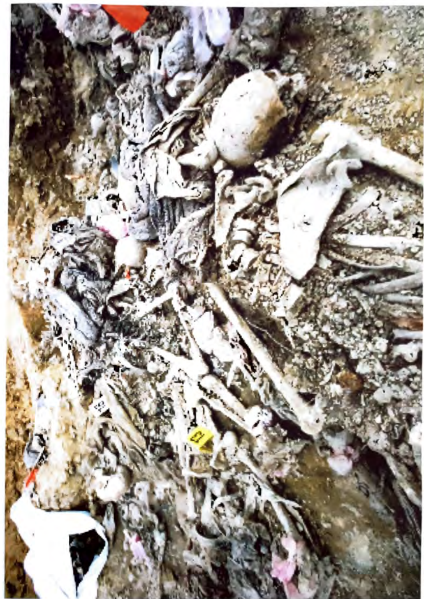
BUDAK - Dokročí zblatka genocida -