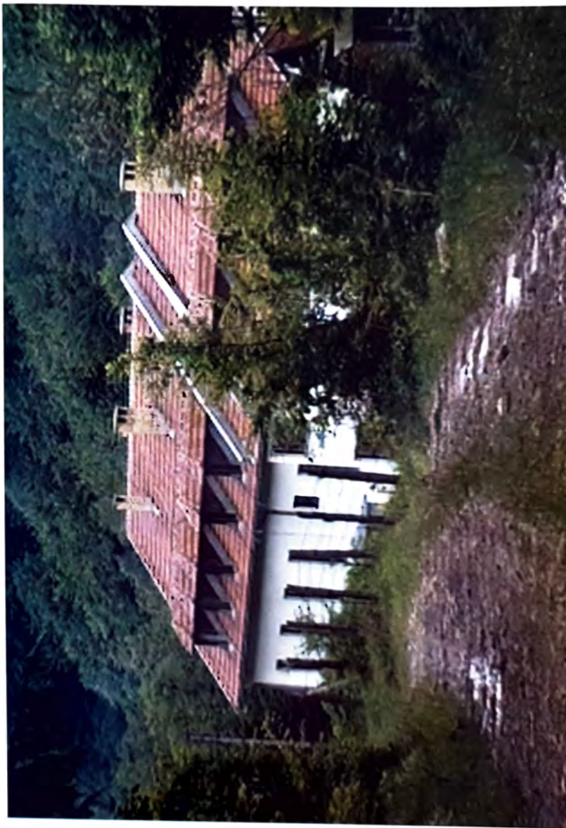
BIŠINA KASARNA — Jedan od objekata gdje su zadržavani Bošnjaci —