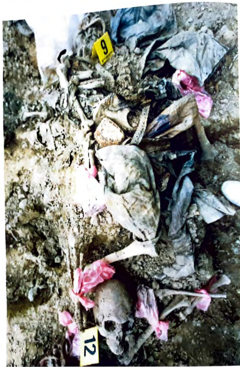
BUDAK – Ostaci skeleta i odjeće –