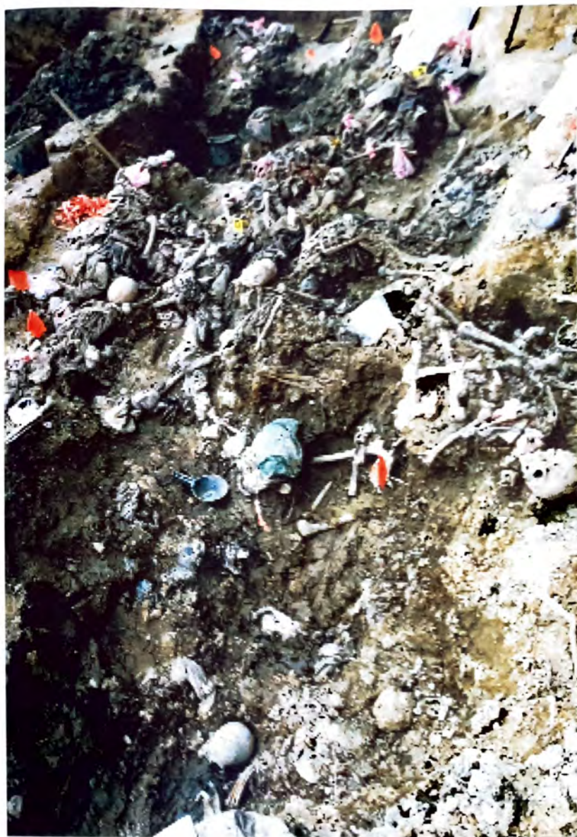
BUDAK — Dokazj globina genocida —