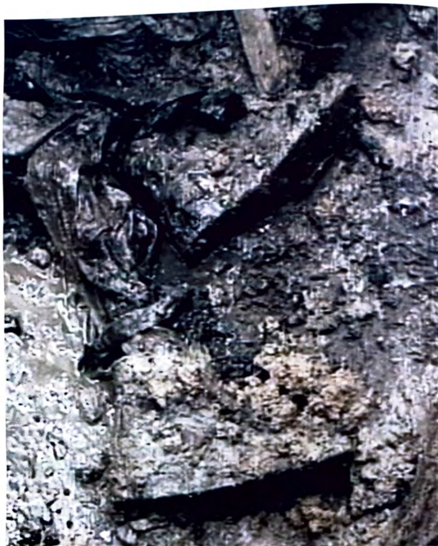
SANDIĆI – Očigledni dokazi genocida –