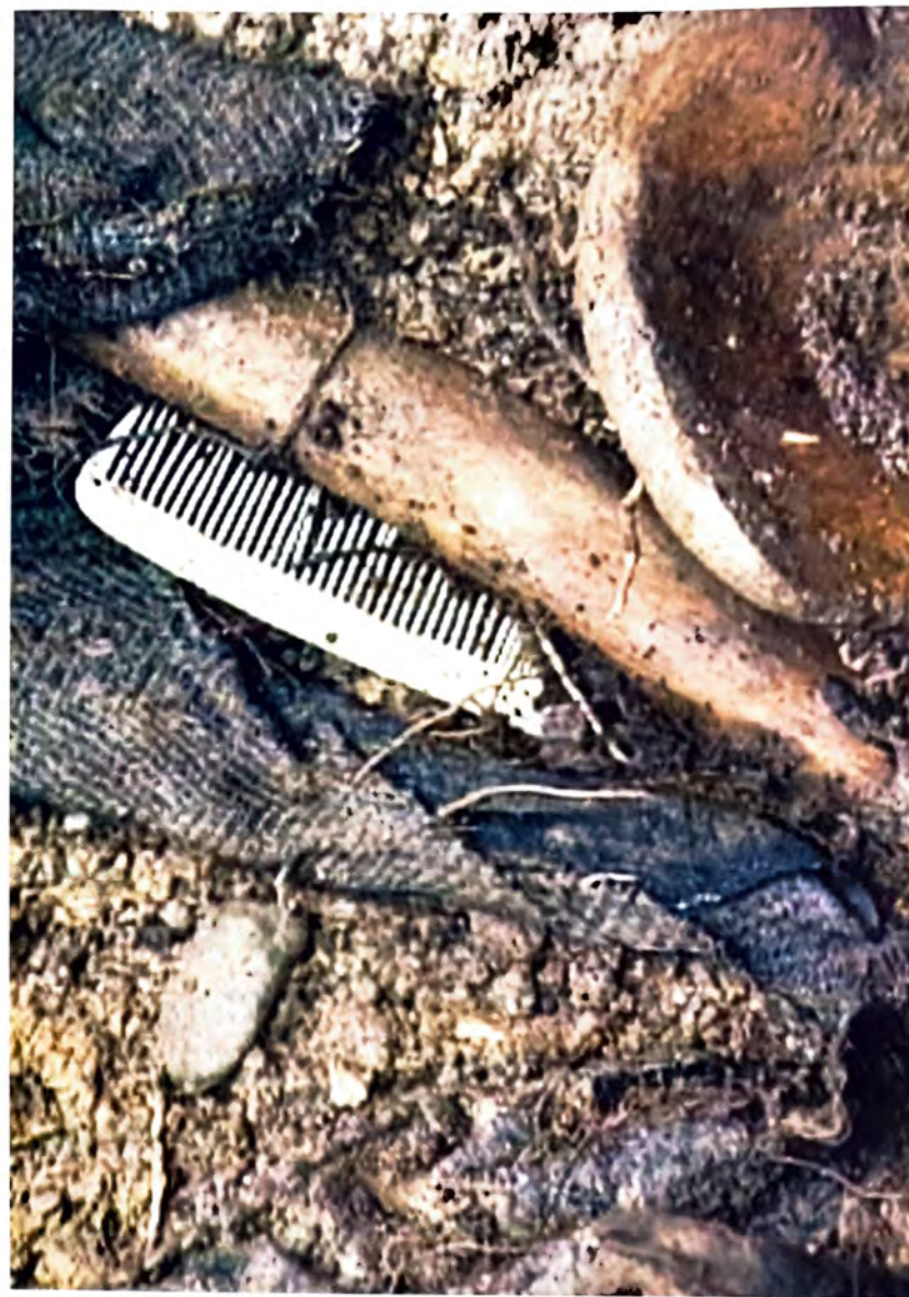
ZELENI JADAR – Ljudni predmeti zrtava pronalazni na mjestu zločina –