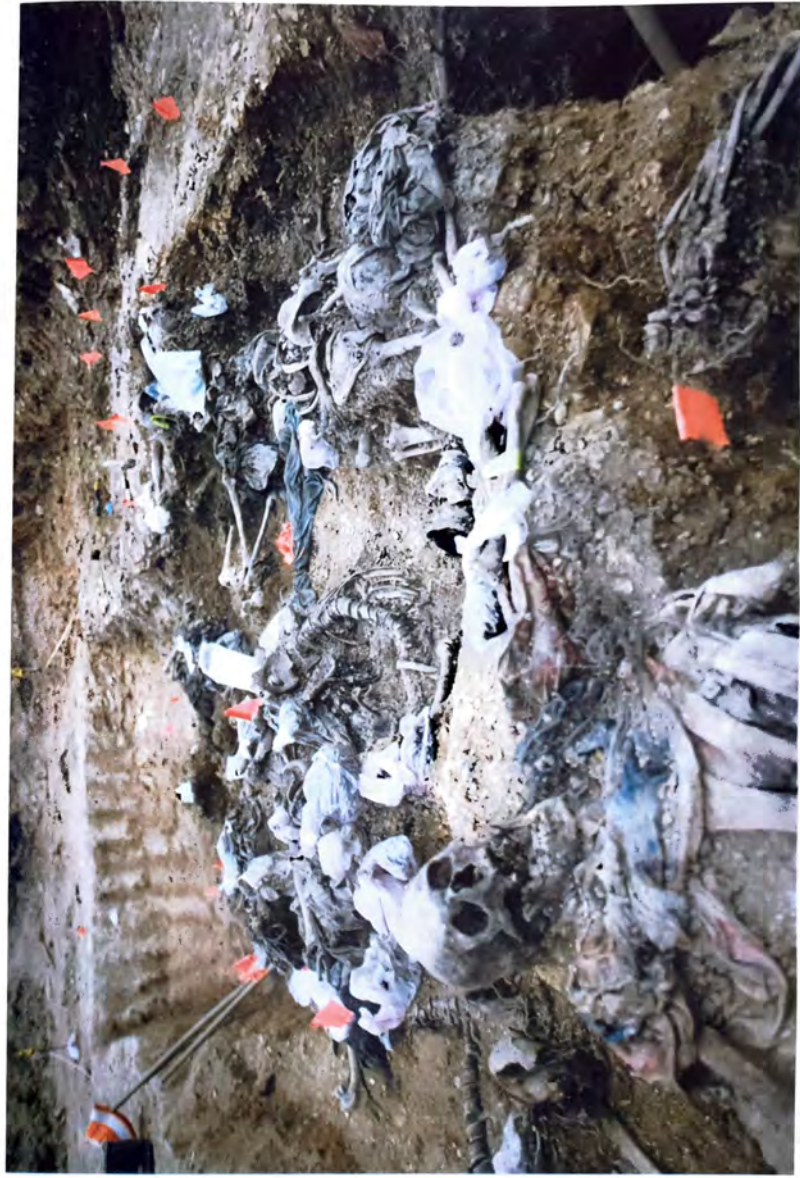
BUDAK — Detaljno obradena masovna grobnica s oznakama dijelova tijela, tragačima mehaničarije koja je korištena prilikom zatrpavanja posmrtnih ostataka —