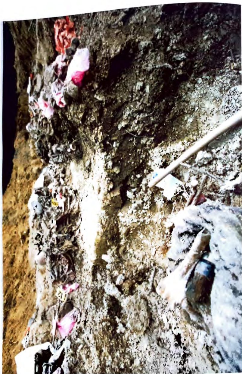
BUDAK - St. Ján, oblasť Brezová rovinka -