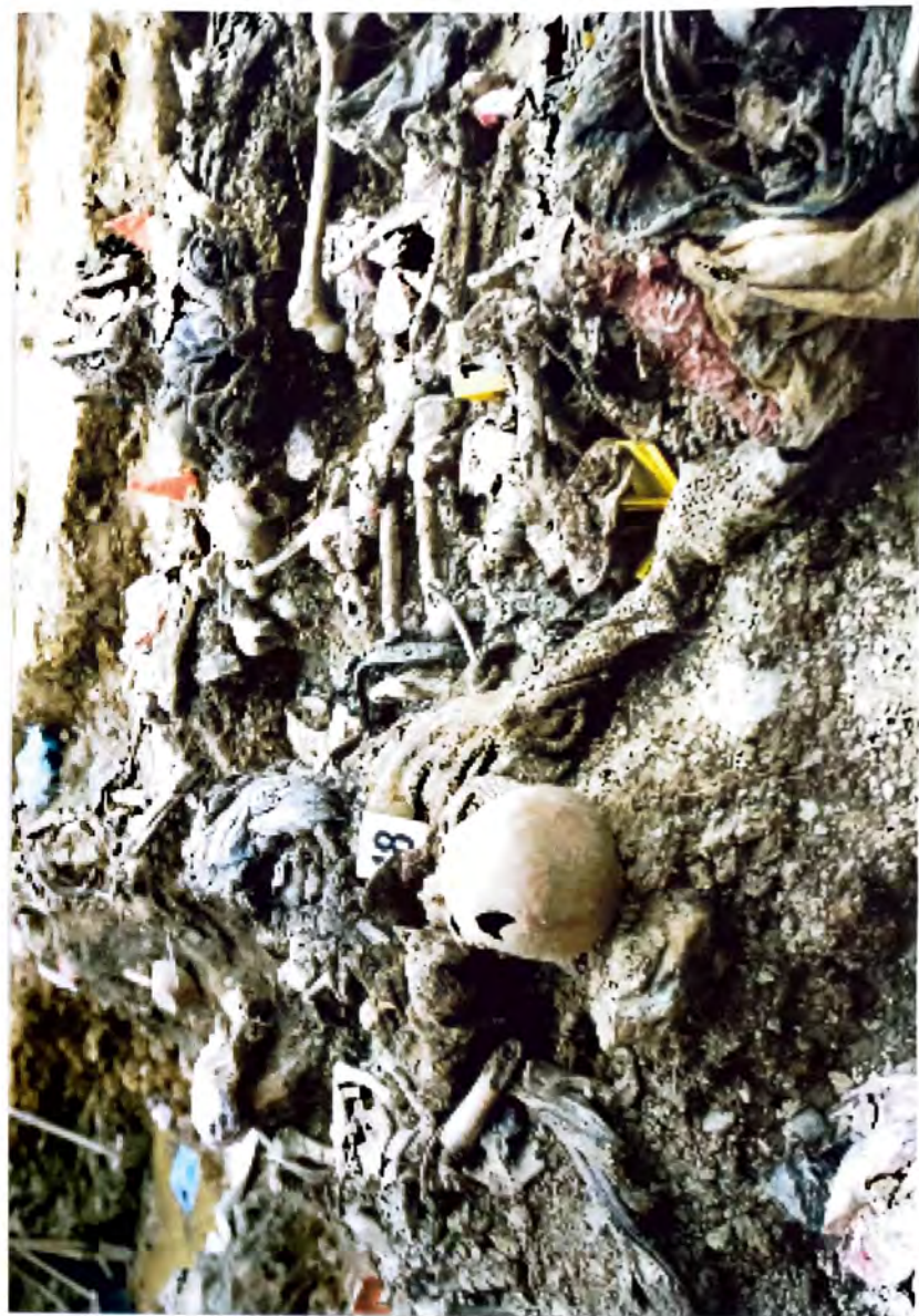
BUDAK - Dokazji zločina genocida -