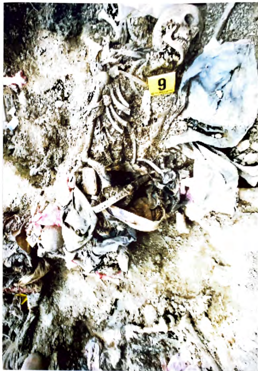
BUDAK – Dokazi o zločinu genocida –