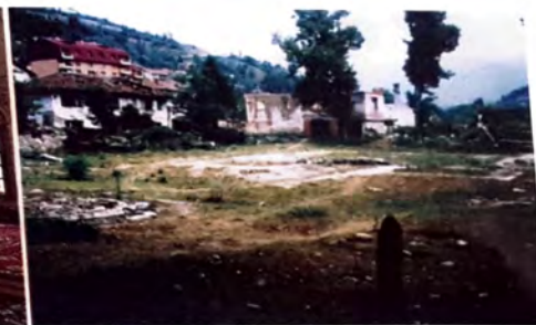
Mjesto na kojem je bila Aladža džamija