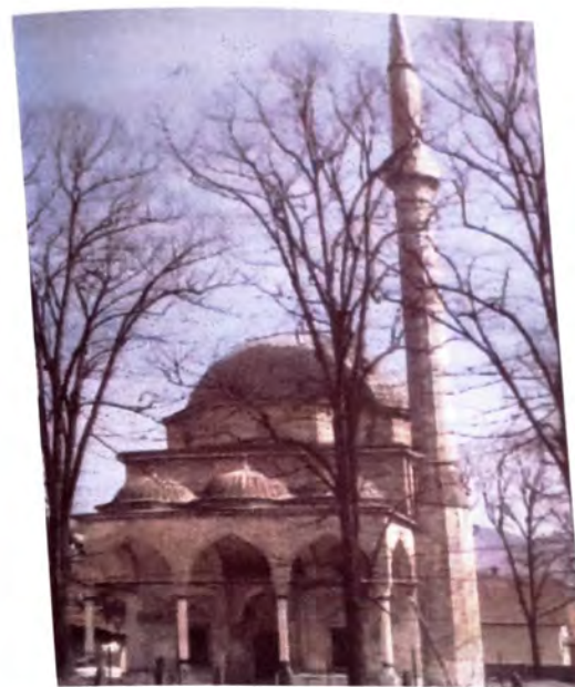
Aladža džamija je srušena 2. augusta 1992.

Ubijeni u junu 1992. godine u selu Bjeliš