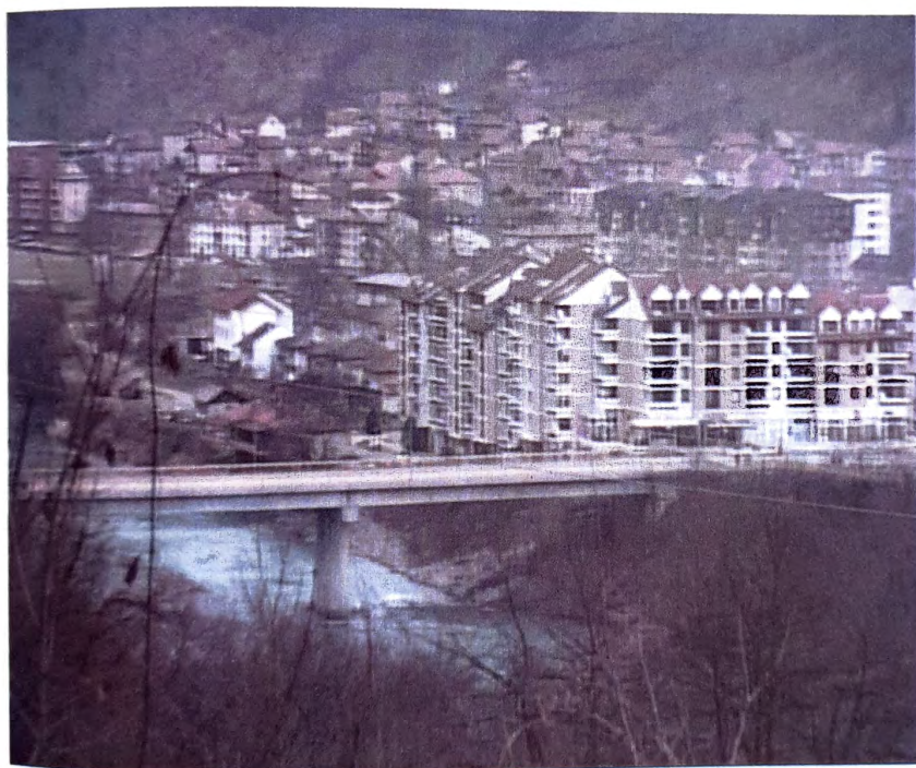
Panorama Foče uoči agresije 1992.