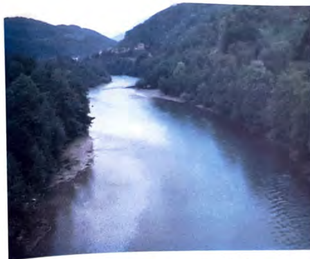
Drina, najveća masovna grobnica Fočaka