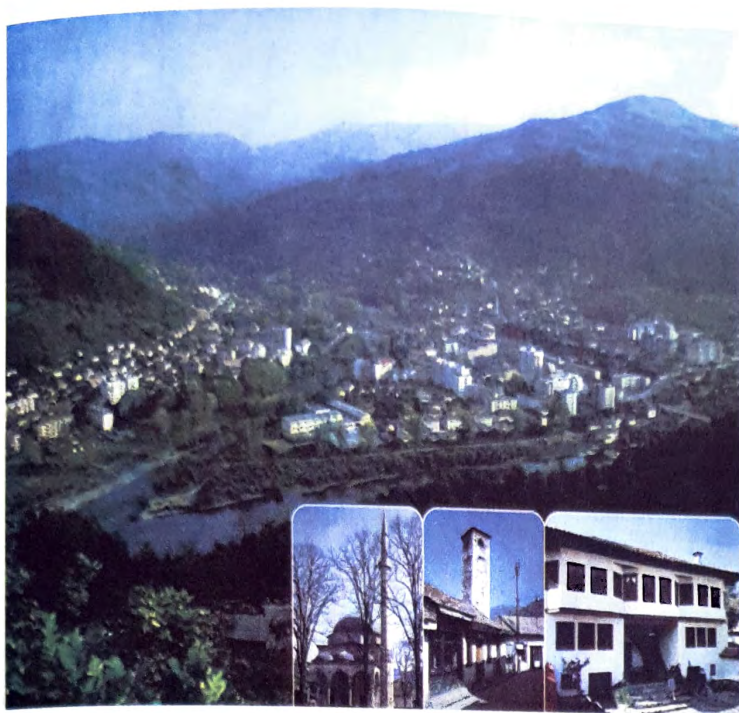
Panorama Foče iz 1975.