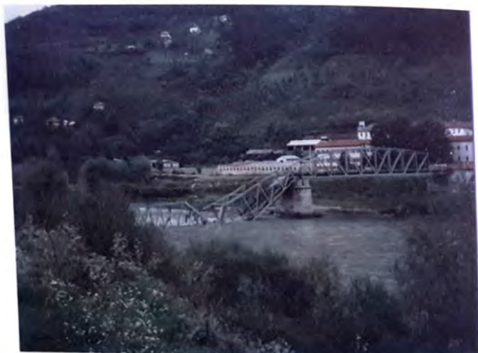
Donji most na Drini nakon dejstva NATO snaga