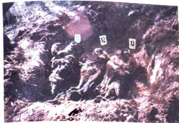
JELEČ - Lokalitet Gradište - Glavica. Grobnica iz koje su ekshumirani ostaci Šundo Mejre, Šundo Fatime i Šljivo Zade. Ekshumacija je izvršena 28. oktobra 1999.