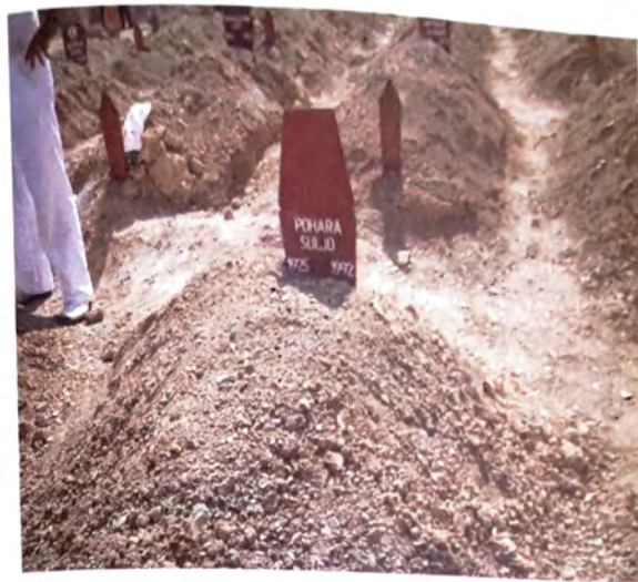
Suljo Pohara jedan je od 294 ubijena starca koji je imao preko šezdeset godina