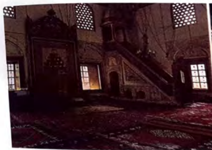
Unutrašnjost Aladža džamije