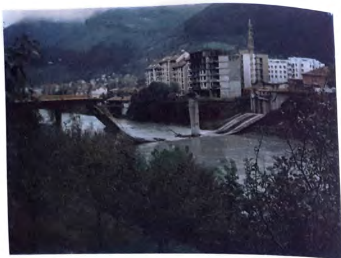
Novi most na Drini nakon dejstva NATO snaga