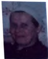
KUKAVICA EMINA (1933)