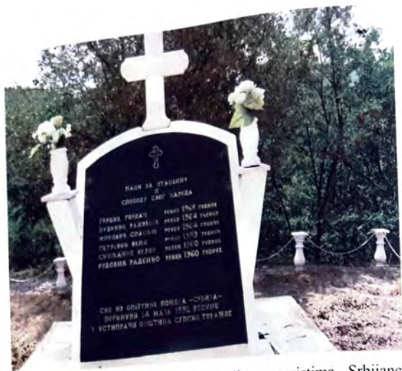
Dokazi agresije. Spomenik podignut poginulim rezervistima - Srbijancima iz općine Požeža u mjestu Kopači kod Goražda