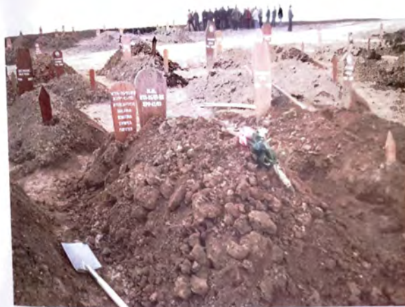
Zajednička grobnica za familiju Kukavica i N.N. osobu