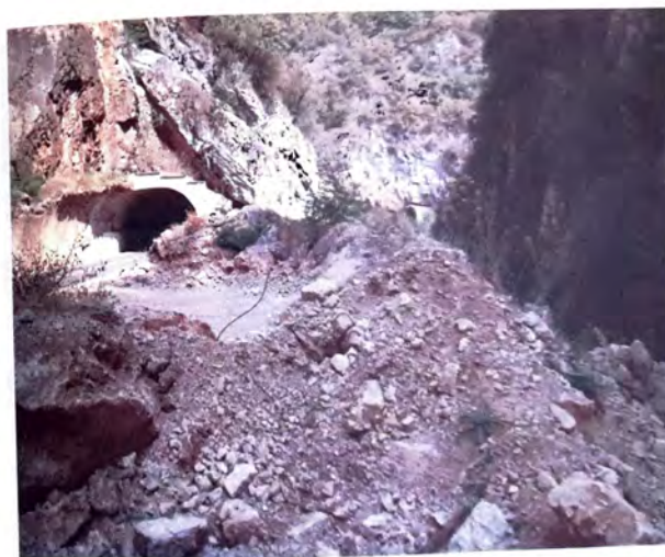
Masovna grobnica kod tunela u Miljevini nakon ekshumacije 52 logoraša iz KPZ