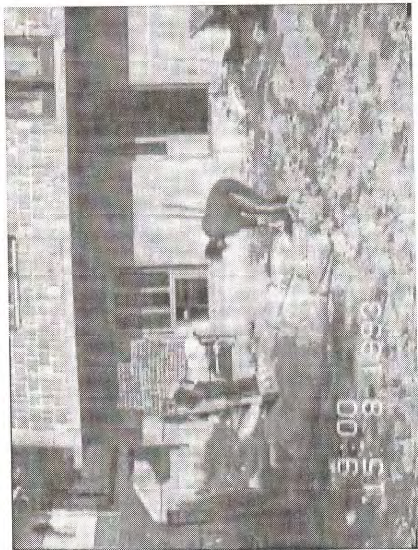
Pregled žrtava zločina u Bagarića gaju, Vrbanja, avgust 1993.