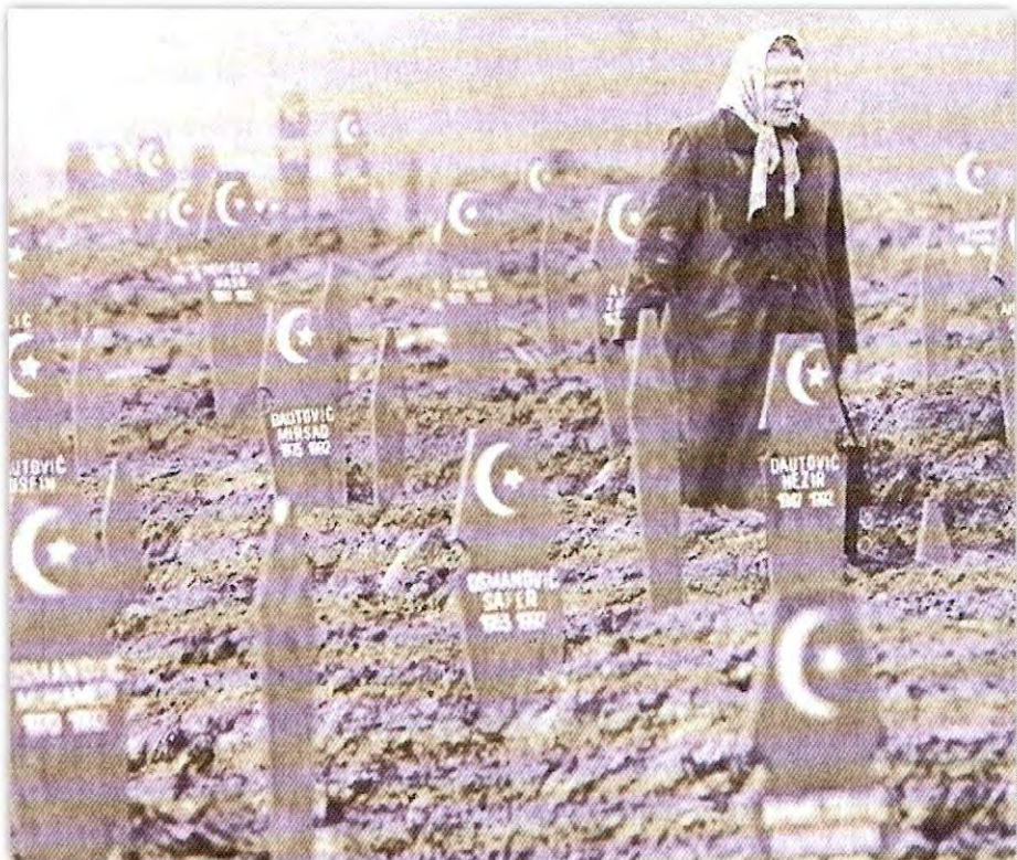
Bosanskohercegovačka stvarnost