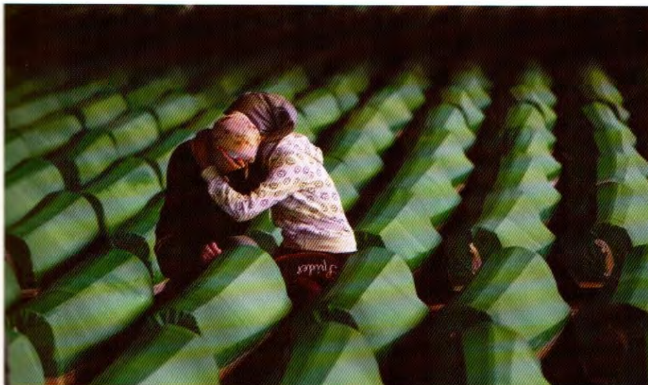
Sudbina Bošnjaka-tabuti u Srebrenici

Francuski pravnik Fransoa Roj (Francoise Roy) u studiji, „ O transformaciji prava naroda iz 1919. godine „ iznio podatke da je u razdoblju od 1946. godine p.n.e iz Trakije u Malu Aziju, osvajanje Tutmesa III i proširivanje Egipatskog carstva duž istočnog Mediterana od obale Eufrata i gornjeg Nila, pa do kraja Drugog svjetskog rata 1945. godine, znači, za 3441 godine u svijetu bilo svega 268 godina mira napsram 3173 godune rata. Svi ili skoro svi ratovi završavali su se nekim pravnim poslom. To su najčešće bili mirovni ugovori. Oni su pored ostalih izvora i u ovim krajevima svijeta veoma značajan izvor međunarodnog i javnog prava.