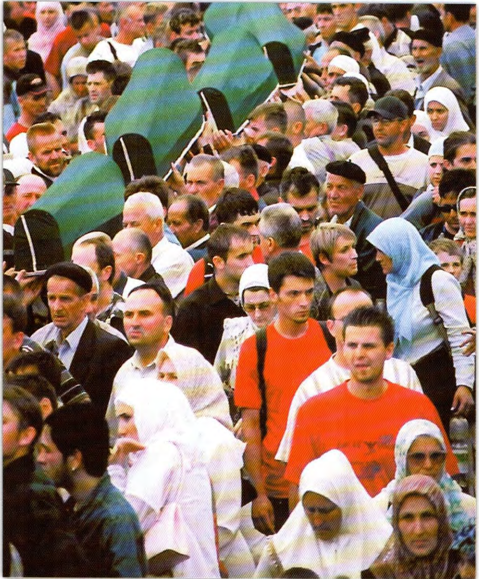
Dženaza i ukop žrtava genocida u Potočarima, Srebrenica u julu 2000