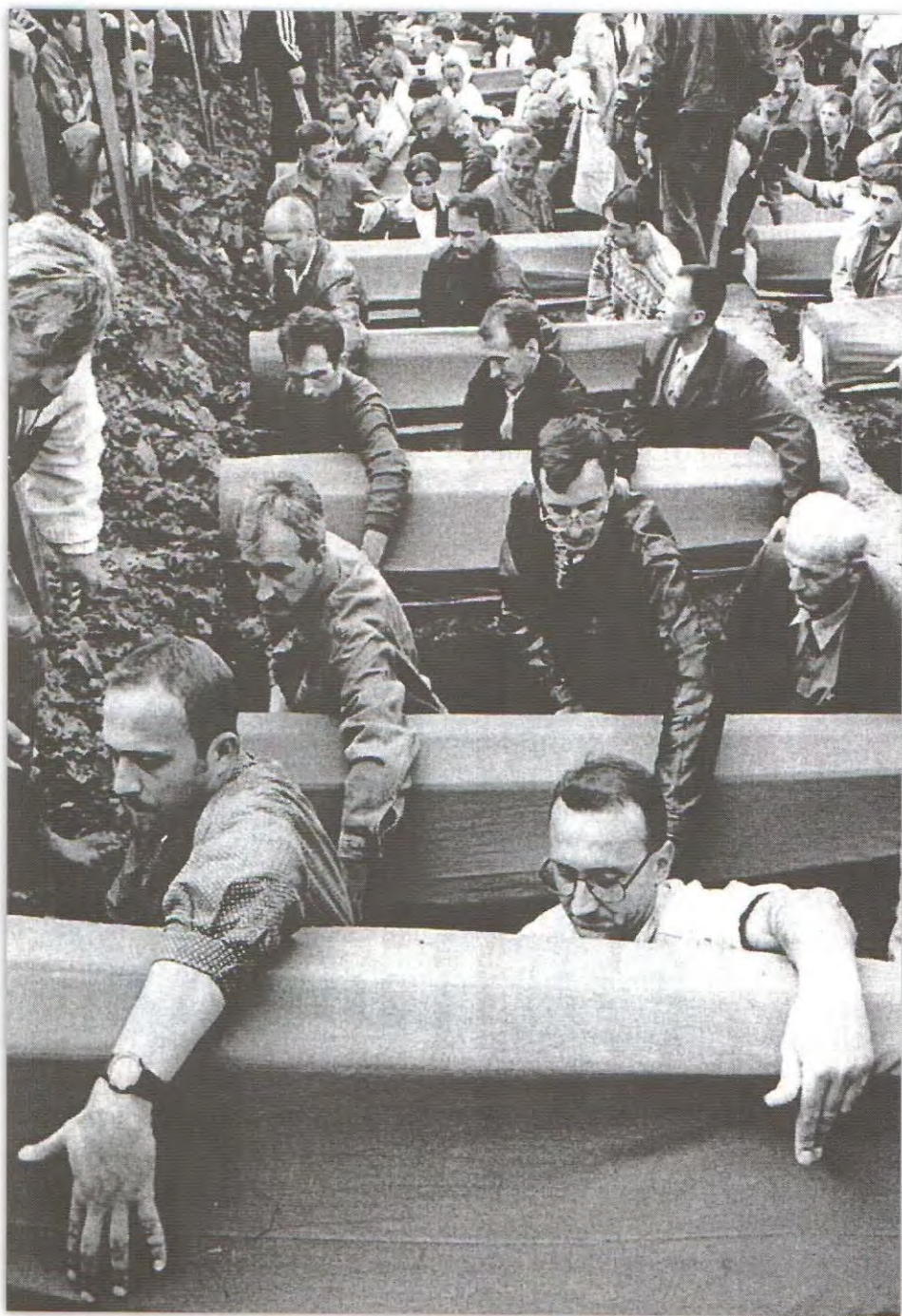
Čarakovo kod Prijedora, dženaza 126 osoba, maj 1999. godine