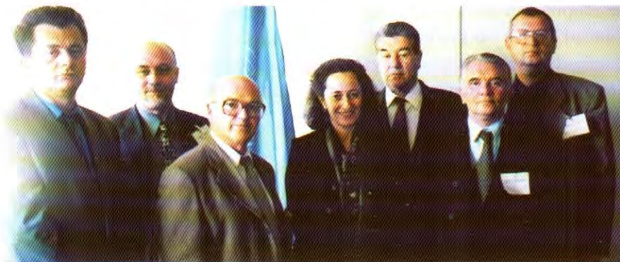
Sudije Doma za ljudska prava iz Bosne i Hercegovine u posjeti i predsjednici Komiteta za ljudska prava UN.

Za studente, nastavnike, istraživače, diplomate i nosioce najviših funkcija u državama skrećemo pažnju da se posebno skoncentrišu na odluke paragrafa na paragraf XII poglavlja Presude – Dispozitiv paragraf/ član 471 paragraf ili stavovi: 1, 2, 3, 4, 5, 6, 7, 8 i 9. To je u stvari suština Presude. Korisnici knjige, zavisno od svog zadatka i interesovanja unutar tih paragrafa/ stavova opredjelit će se koji će od njih biti predmet njihovog interesovanja ili koji će biti vodeći u tome.