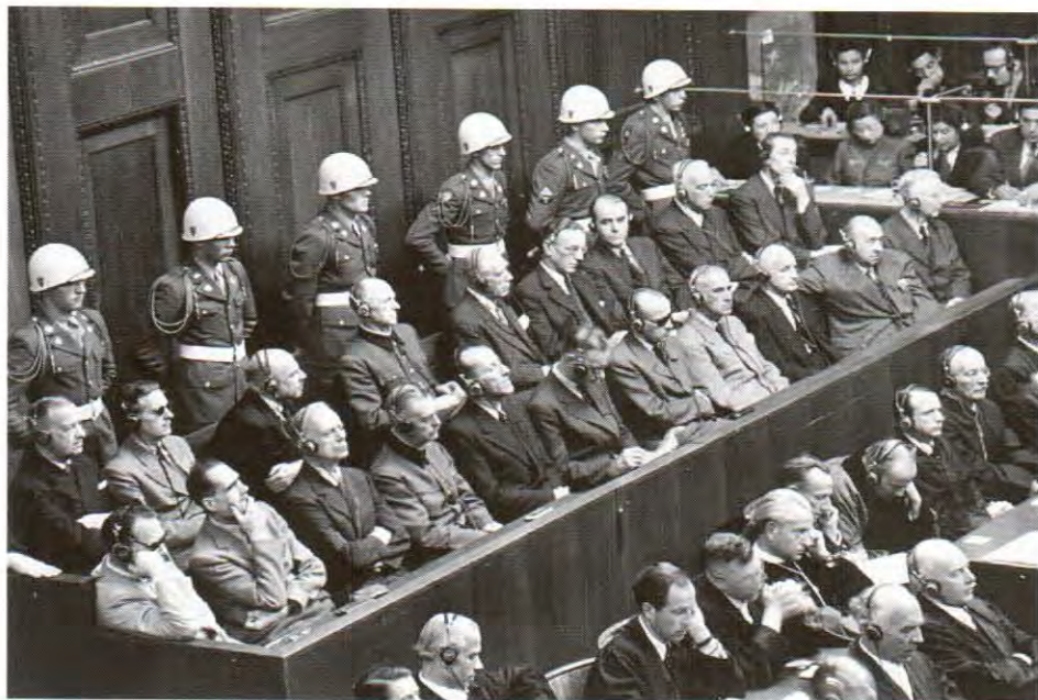
Fotografija sa suđenja nacističkim zločincima u Nürnbergu 1946.god.

Sudija Džekson u svom izvještaju predsedniku 7. oktobra 1946. godine o presudi Međunarodnog vojnog suda u Ninbergu