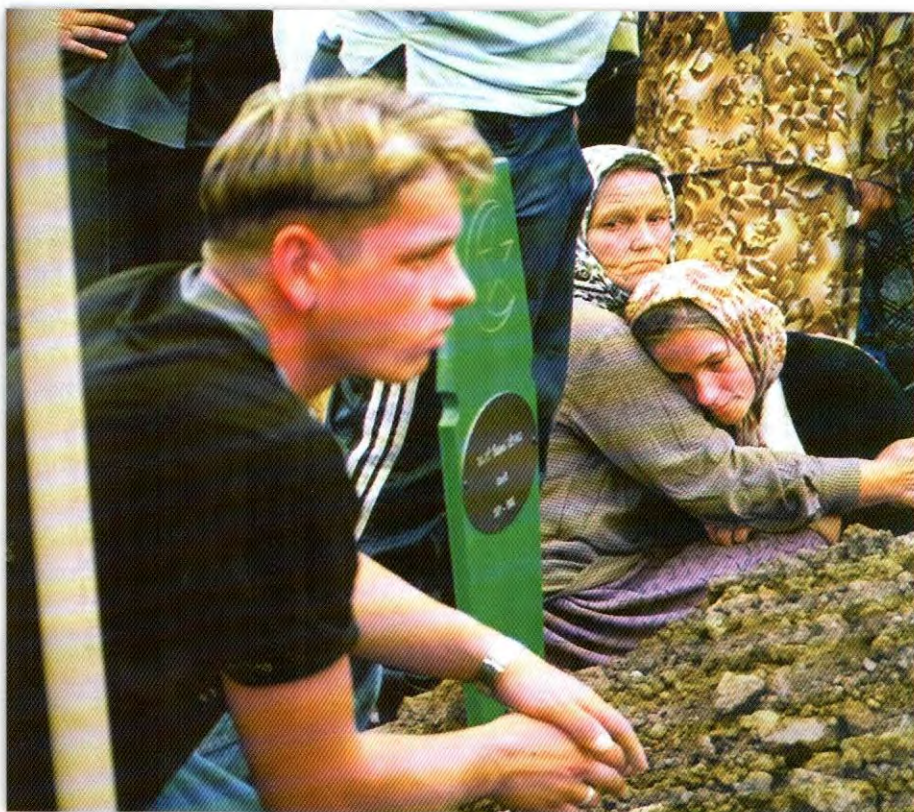
Ovaj ljudski bol ne može da stane u sudski spis.