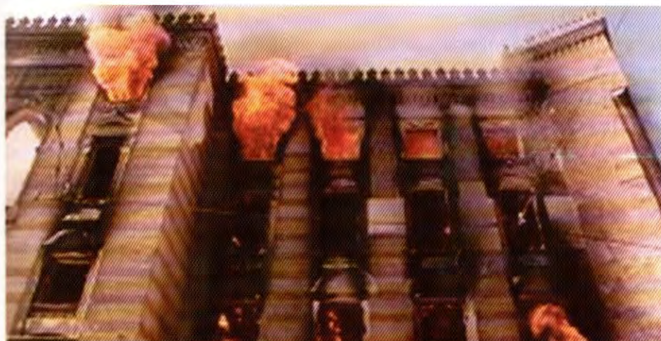
Univerzitetska biblioteka u plamenu, zapaljena od srpske artiljerije 1992