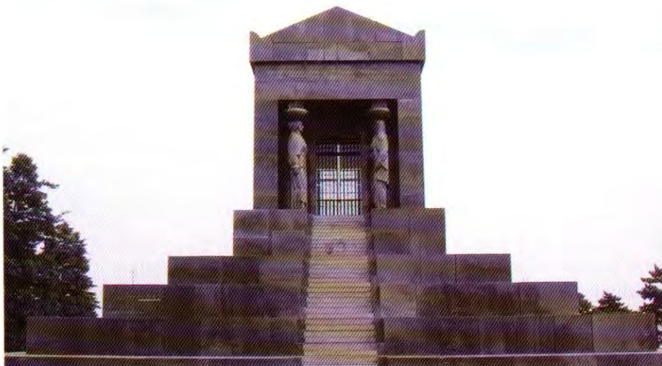
Grob neznanog junaka na Avali