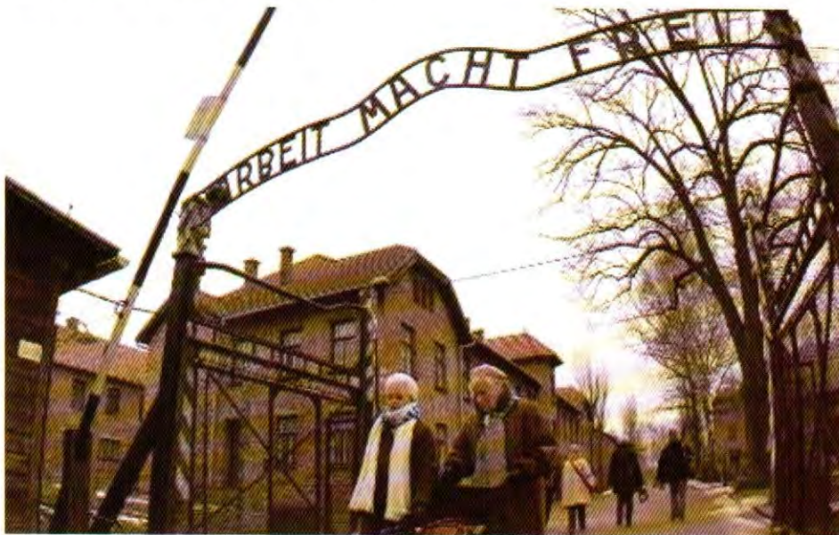
Ulaz u Aušvic